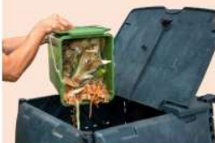
Composteur et/ou animaux