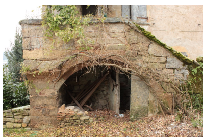
Fig. 50 - Façade principale, perron.