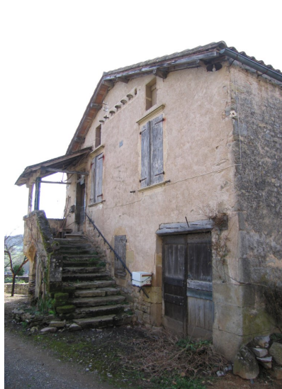
Fig. 47 - Vue de trois-quarts de la façade principale.