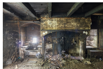
Fig. 18 - Premier étage, équipement du mur oriental : cheminée, évier, placards muraux.