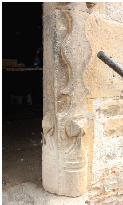
Fig. 55 - Piédroit droit de la porte.