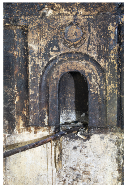
Fig. 21 - Niche ornée du contre-cœur de la cheminée.