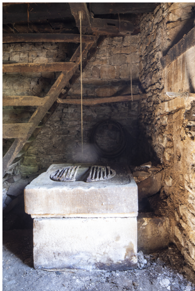
Fig. 37 - Partie haute de la citerne.