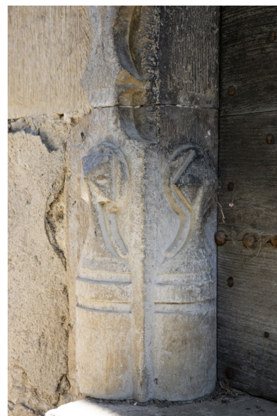
Fig. 12 - Décor de la base du piédroit.