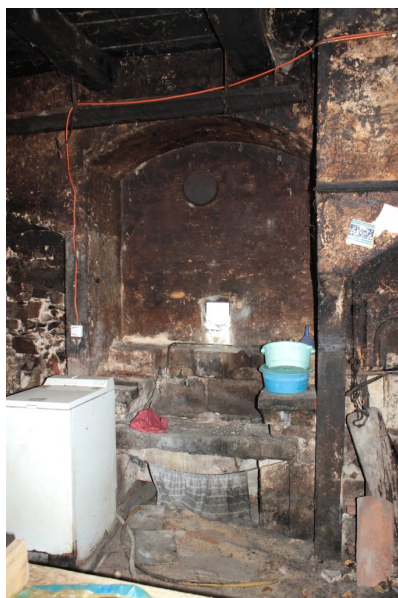
Fig. 59 - Evier et placard mural.