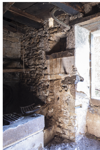
Fig. 36 - Vestiges des aménagements de récupération des eaux pluviales.