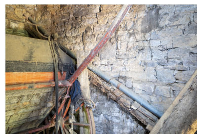
Fig. 39 - Vue de la conduite en bois des eaux pluviales.