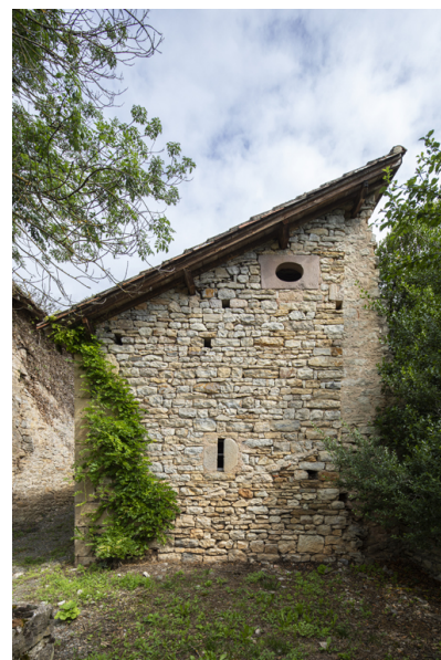
Fig. 42 - Elévation postérieure de la grange.