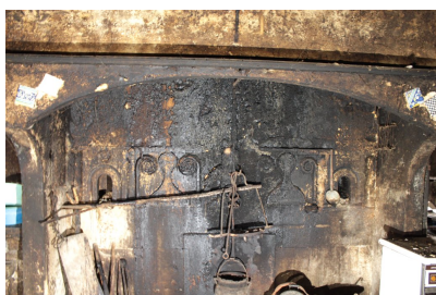
Fig. 58 - Détail du décor du contre-cœur de la cheminée.