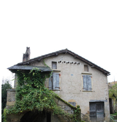
Fig. 46 - Vue de la façade principale.