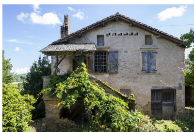
Fig. 1 - Façade principale de la maison.