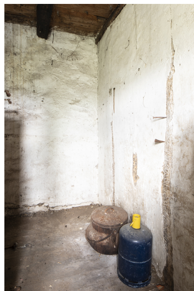
Fig. 27 - Annexe de la cuisine.