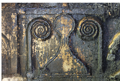
Fig. 22 - Décor du contre-cœur de la cheminée.