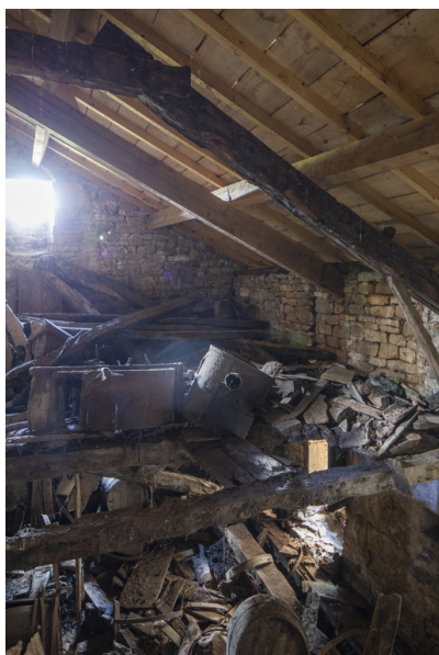
Fig. 40 - Vue intérieure de la grange attenante.