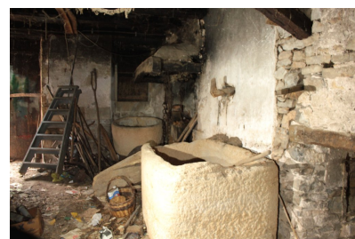
Fig. 63 - Cuves situées au rez-de-chaussée.