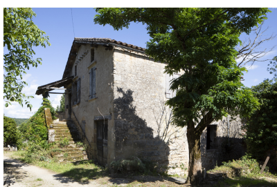
Fig. 4 - Vue de trois-quarts.