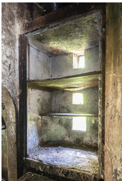
Fig. 25 - Placard mural.