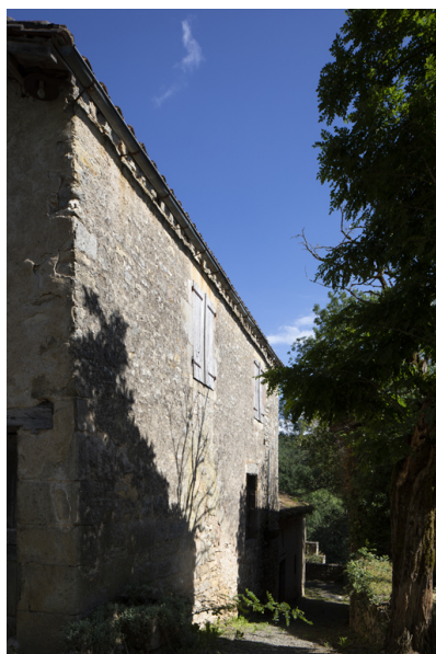
Fig. 41 - Elévation occidentale.