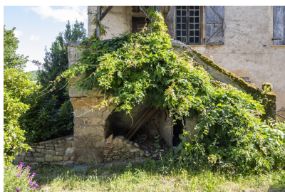
Fig. 7 - Vue de l'escalier extérieur et du perron.