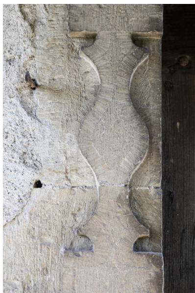
Fig. 11 - Piédroit gauche de la porte, décor de balustre.