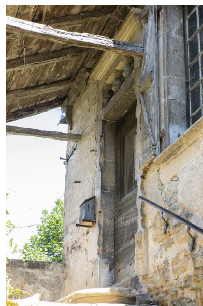
Fig. 9 - Porte vue de trois-quarts.