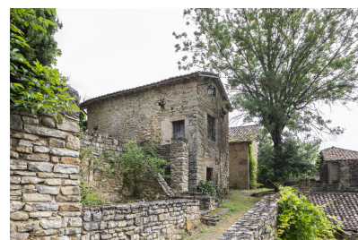
Fig. 45 - Elévations donnant sur la rue en contrebas.