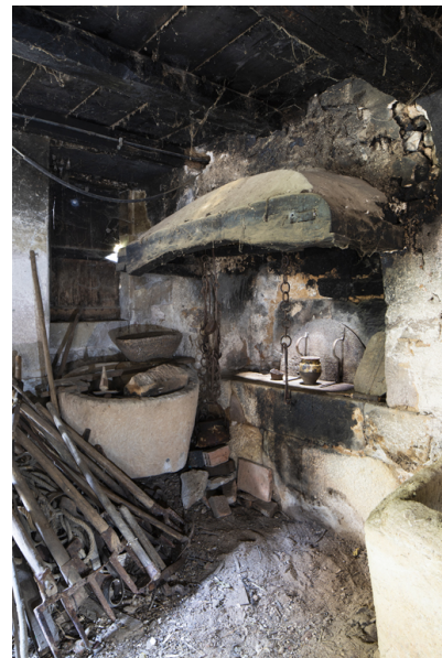
Fig. 33 - Four à pain et forge.