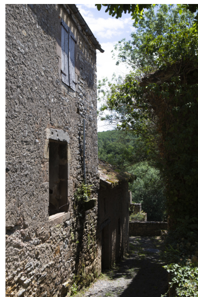
Fig. 15 - Elévation occidentale avec vestiges des conduites d'eaux pluviales.