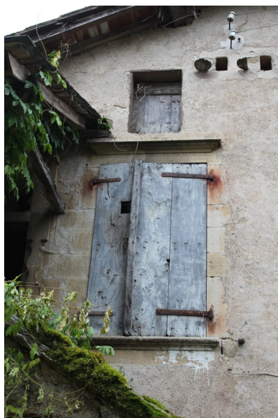
Fig. 56 - Façade principale, fenêtre.