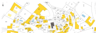
Fig. 2 - Extrait cadastral, 2017 AB 260.