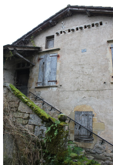
Fig. 48 - Détail de la façade principale.