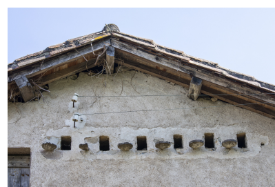
Fig. 6 - Façade principale, plages d'envol et sorties du pigeonnier.