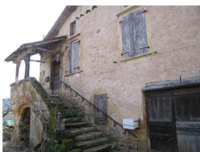
Fig. 49 - Façade principale.