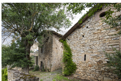
Fig. 43 - Elévation postérieure de la grange.