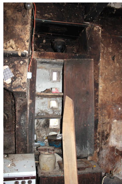
Fig. 60 - Placard ajouré situé contre la cheminée.