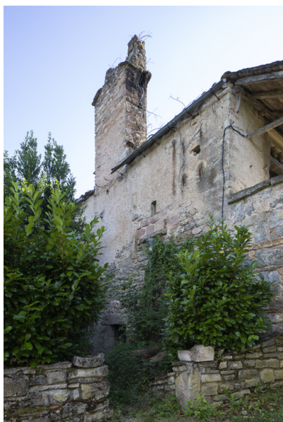
Fig. 13 - Elévation orientale couronnée de la souche de cheminée.