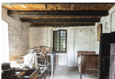
Fig. 28 - Chambre.