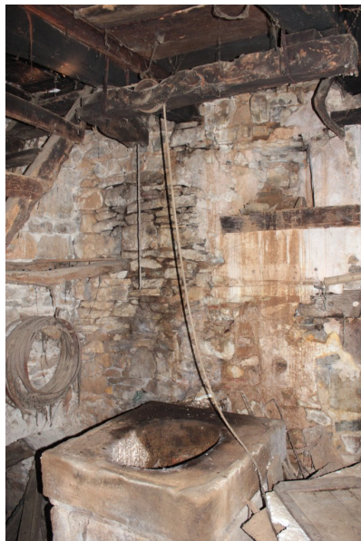
Fig. 65 - Partie supérieure de la citerne et vestiges des conduites d'eau.