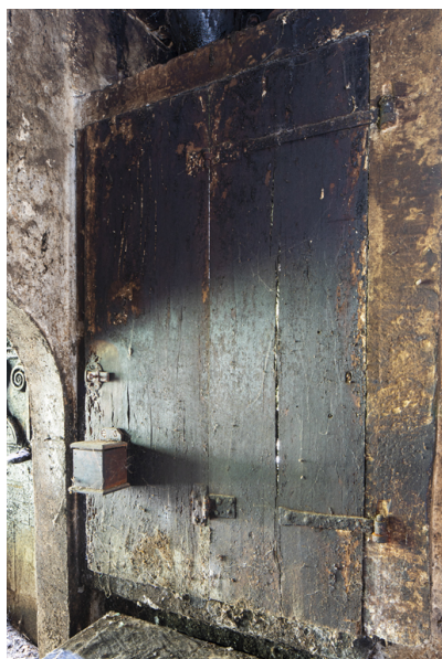
Fig. 26 - Porte du placard mural.