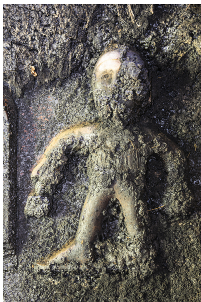
Fig. 23 - Contre-cœur de la cheminée, personnage central.