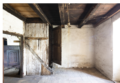
Fig. 30 - Annexe de la chambre.