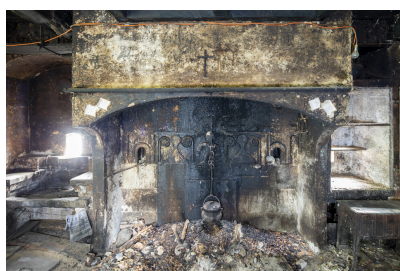
Fig. 20 - Cheminée.