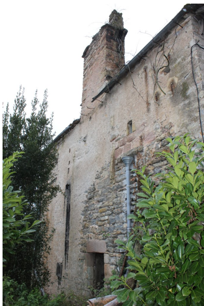
Fig. 61 - Elévation orientale de la maison.