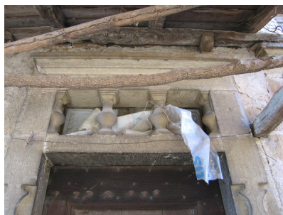
Fig. 53 - Porte, détail de l'imposte.