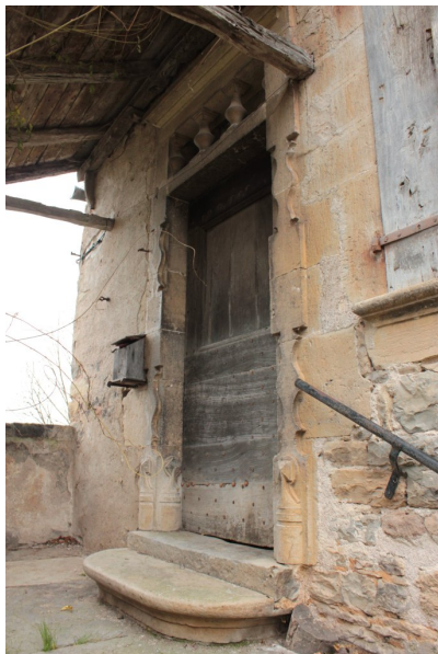
Fig. 52 - Façade principale, porte.