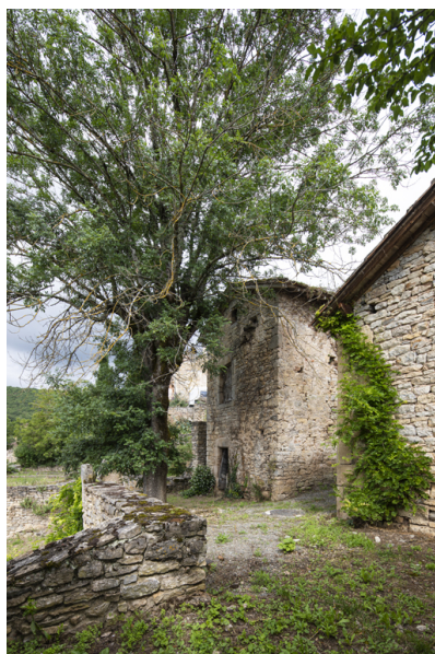
Fig. 44 - Vue des élévations sur la rue en contrebas.