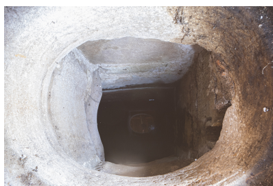
Fig. 38 - Vue de l'intérieur de la citerne depuis le haut.