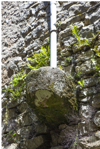
Fig. 17 - Récupération des eaux pluviales.