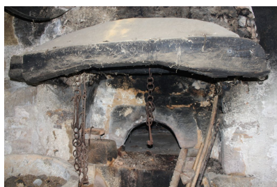
Fig. 62 - Rez-de-chaussée, four.