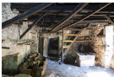
Fig. 35 - Aménagement du fond du rez-de-chaussée.