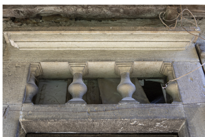
Fig. 10 - Imposte ajouré à balustres.