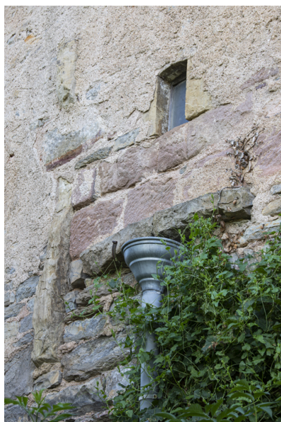
Fig. 14 - Evacuation extérieure de l'évier.