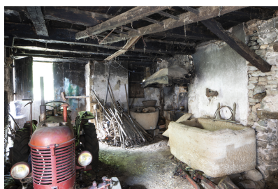
Fig. 32 - Aménagement du rez-de-chaussée.