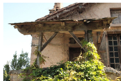
Fig. 51 - Façade principale, couvrement du perron.