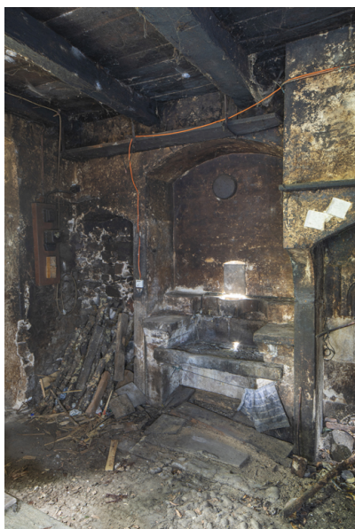
Fig. 19 - Evier.