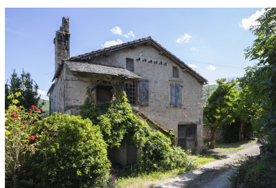
Fig. 5 - Vue de trois-quarts de la maison.