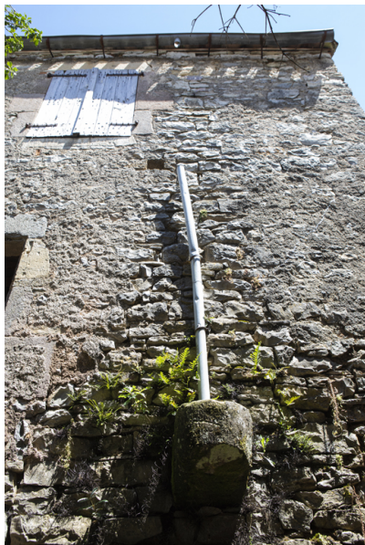
Fig. 16 - Elévation occidentale, système de récupération des eaux pluviales.