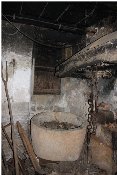
Fig. 64 - Cuve située sous la baie du rez-de-chaussée.