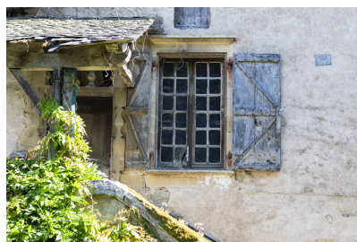
Fig. 8 - Façade principale, porte et fenêtre.