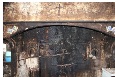
Fig. 57 - Vue de la cheminée.