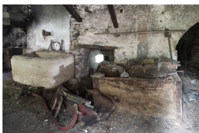
Fig. 34 - Cuve en pierre et bac en bois.