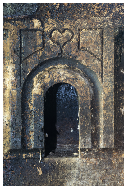
Fig. 24 - Niche ornée du contre-cœur de la cheminée.