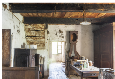
Fig. 29 - Chambre.