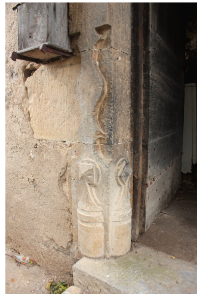
Fig. 54 - Piédroit gauche de la porte.